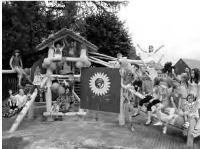
Kinder auf den Spielgeräten

Und damit keiner sich verletzt, wenn es einmal schneller auf den Boden geht als gedacht, sind als Fallschutz polyurethanverbundenes Gummigranulat als Gitterplatten mit Rasenein-saat verlegt.