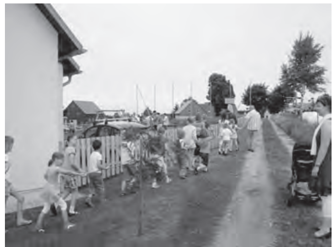
Matthias Haase führt die Kinder zum Spielplatz

Die Kombination der verschiedenen Bewegungsmöglichkeiten konnten in gemeinsamen Beratungen bedacht und von Matthias Haase in einen sinnvollen Rahmen zusammengestellt werden. Dabei spielte die Benutzbarkeit für verschiedene Altersgruppen (5 – 14 Jahre) eine wesentliche Rolle.